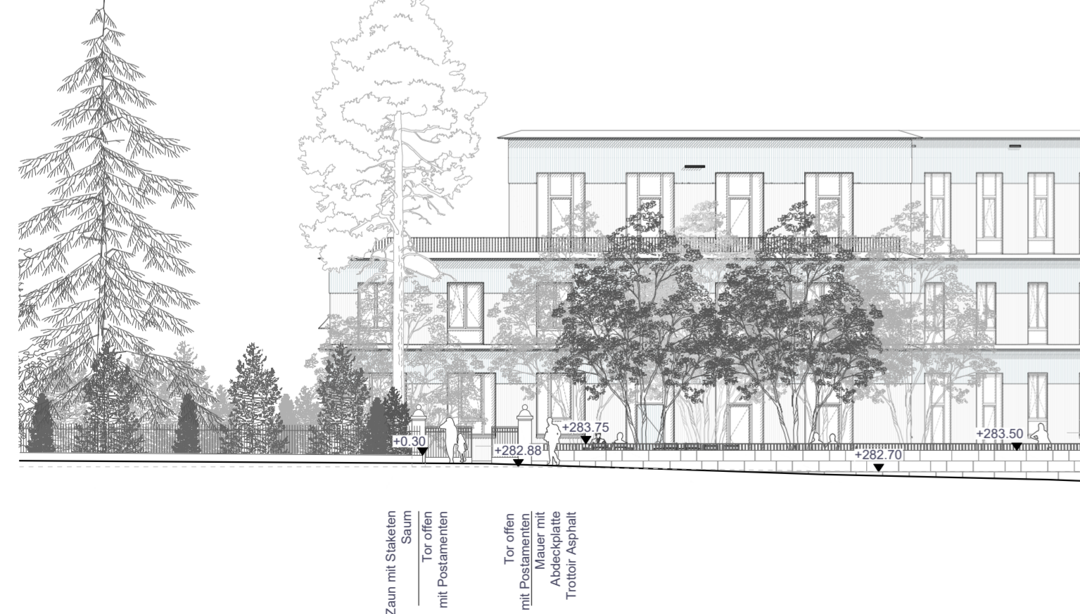
Schnittansicht C-C' M 1:200